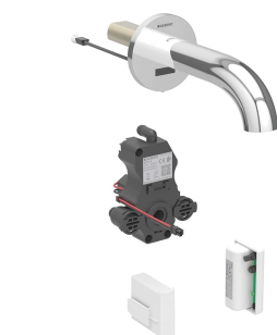
Imagen de ejemplo